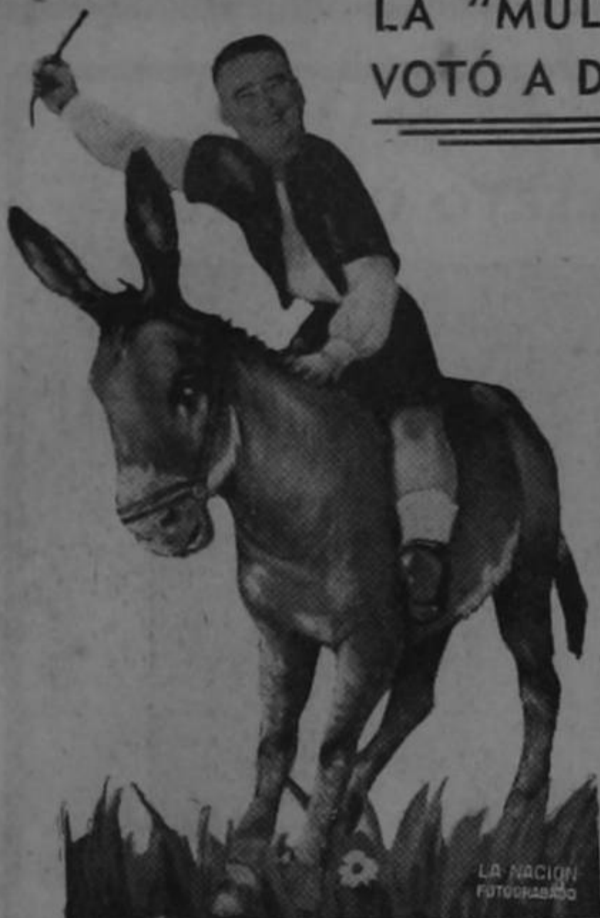
LA NACIÓN FOTOGRAFÍA

El señor presidente de la República estuvo hace algún tiempo de gira política por la frontera norte de Tiquicia. En los Chiles departió muy buenos ratos con Tacho viejo. Tomó pinolillo y "tijste" y nacatamal con tequila.