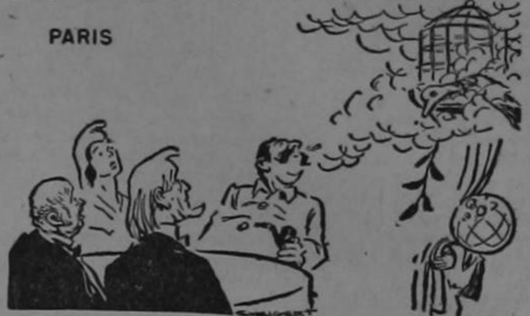
DEL DIARIO "THE SAN FRANCISCO CHRONICLE" DE SAN FRANCISCO, CALIFORNIA, E.U.A.

Esta caricatura, recientemente apareció en "The San Francisco Chronicle", diario publicado en San Francisco de California, Estados Unidos de América. En Moscú, en la parte superior, Stalin le da de comer a la paloma de la paz con